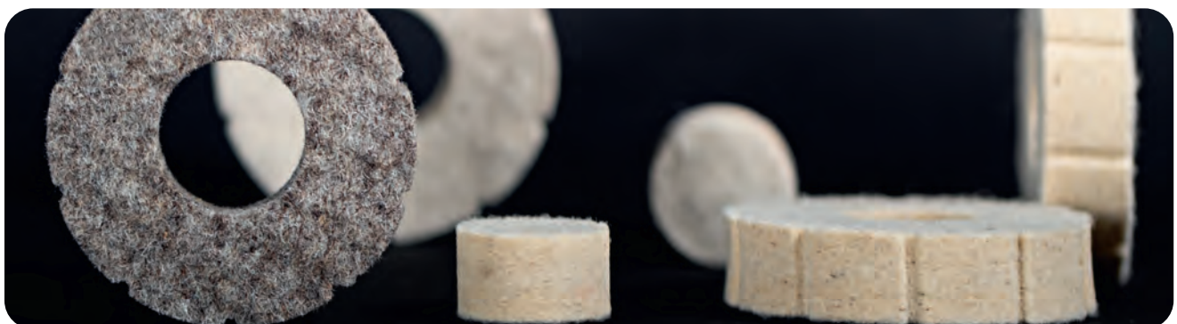
Filzteile nach Zeichnung oder Massangabe geschnitten, gestanzt, gebohrt, formgeschliffen.

Punched parts as sealing, standard rings according to DIN 5419