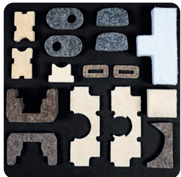
Stanzteile als Dichtungen, Normringe nach DIN 5419.

Self-adhesive felt of various shapes and dimensions bumper-die stamped, for scratch protection, insulation and sound absorption in a car, etc.